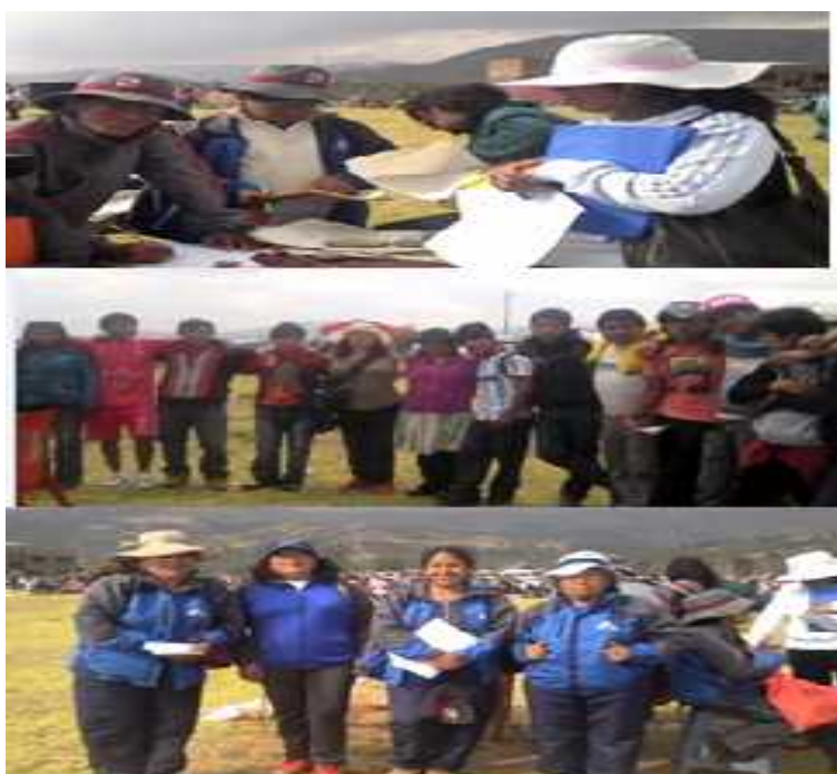
Día De La Familia Agustina, en compañía de los docentes, estudiantes y padres de