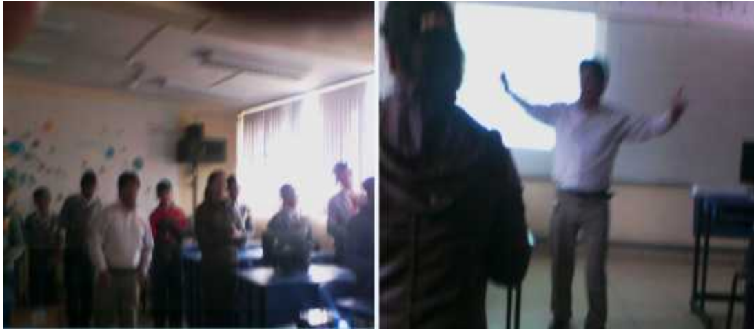
Taller de relaciones Interpersonales y liderazgo