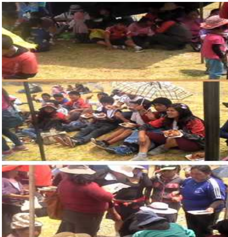
Las familias compartiendo el almuerzo en el día de la familia