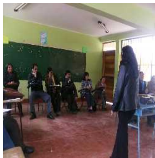
Talleres de reflexión y las charlas de sensibilización que se desarrollaron sobre relaciones interpersonales con la psicóloga de IDEL y Fundación Telefónica.