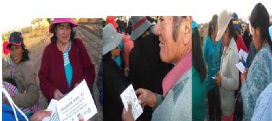
Padres de familia en el terreno Santa Rosa que se utilizó como espacio de reflexión sobre relaciones interpersonales.