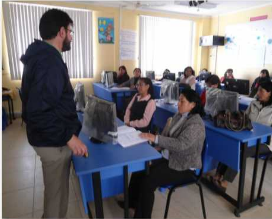
Taller de sensibilización con docentes