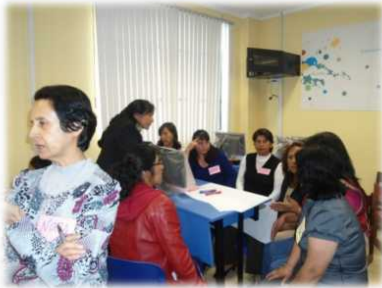
Uno de los taller de formulación del PEI