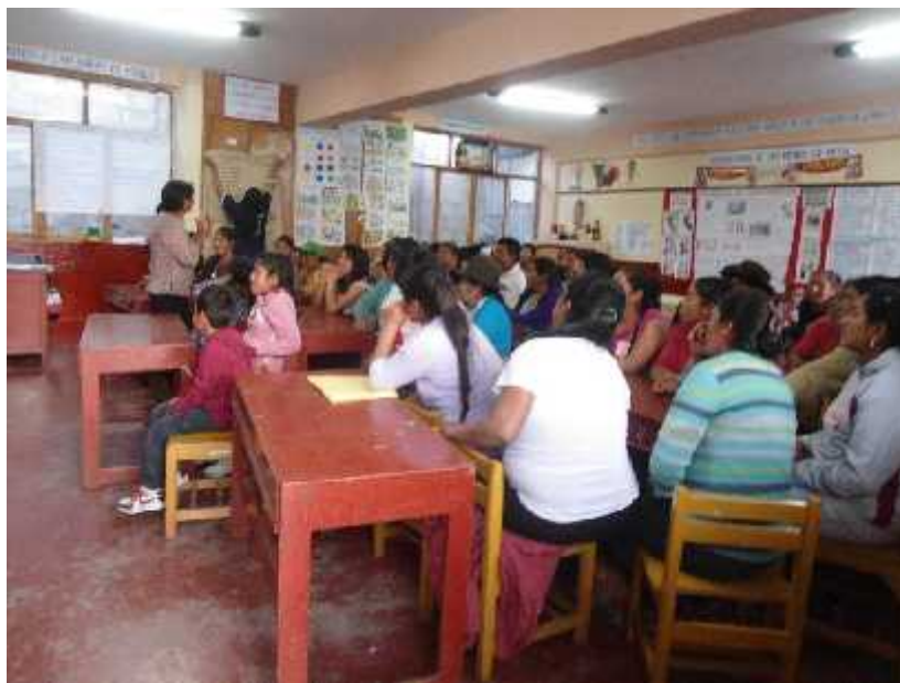
Recogiendo el parecer de padres de familia para la formulación del PEI