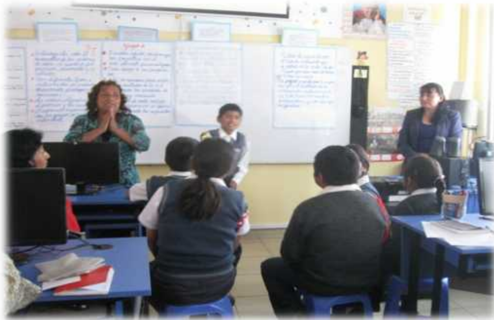
Grupo de reflexión con los estudiantes y docentes